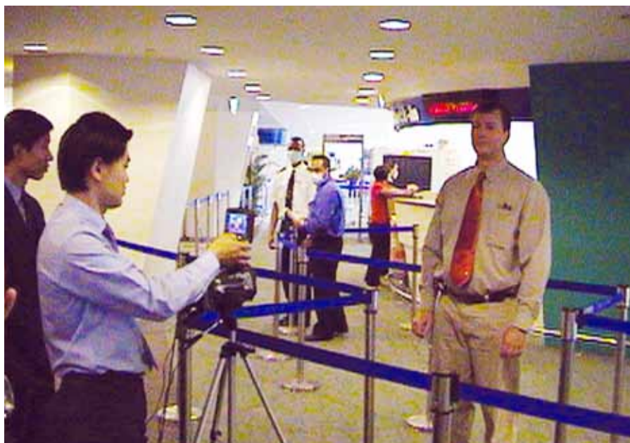
Mise en place d'une caméra infrarouge FLIR avec ATC (Automatic Temperature Compensator), pour la détection des températures corporelles élevées.

La température de la peau est influencée par l'environnement, même en cas de fièvre. Mais les personnes fiévreuses auront tout de même une peau plus chaude que les autres, soumises aux mêmes conditions environnementales. Exclusivité de FLIR Systems, l'ATC (Automatic