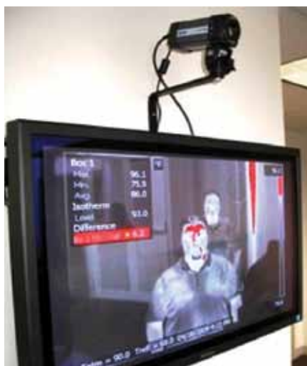
Caméra FLIR A320 fixe dont l'alarme de couleur est activée.

La thermographie infrarouge fournit en temps réel une image des températures de la peau. De plus, les caméras infrarouges sont des appareils très sensibles. Les caméras FLIR mesurent des différences de température d'à peine 0,07 °C.